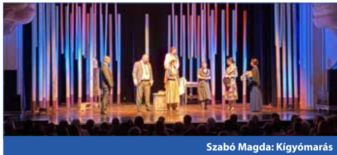
Szabó Magda: Kígyómarás

Egy lidércesen rossz házasság van a regényben előttünk, melynek itt, a darabban az eredetét is látjuk. A főalak, a nő, egy szörnyeteg a regényben, de a színdarabban ennek az indoklása is megtalálható. A darab elénk tárja a folyamatot is, melynek során a szörnyé válás megtörténik. A regényben van egy kisfiú, aki a levágandó disznó mel-