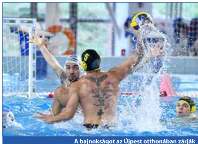
A bajnokságot az Újpest otthonában zárják