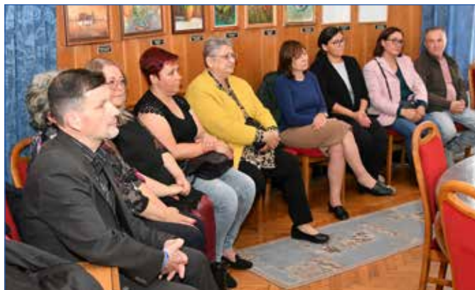
Összesen 1500 családi fürdőbelépőt adtak át az intézményeknek