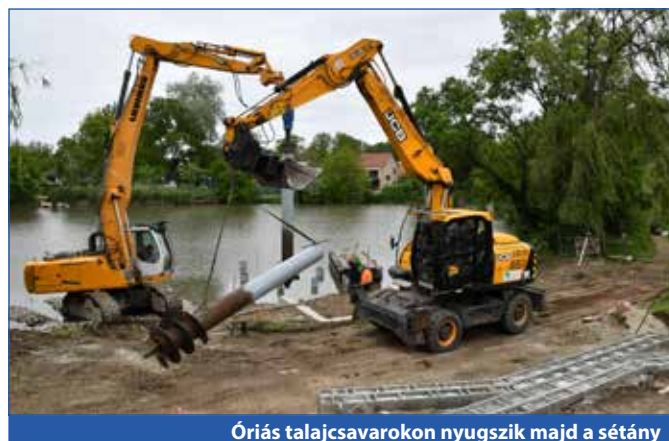
Óriás talajcsavarokon nyugszik majd a sétány

A beruházás során a sétány teljesen átalakul: épülnek járdák, lépcsők, korlátok, esőbeálló, ülőfalak, kerékpártámaszok,