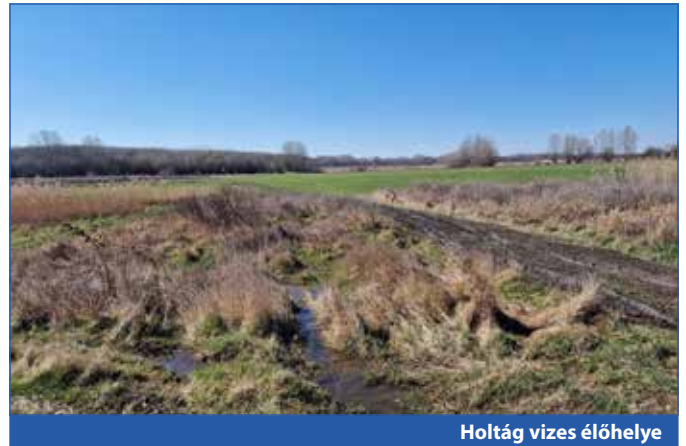
Holtág vizes élőhelye