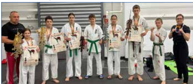
Öt karatéka éremmel zárt.