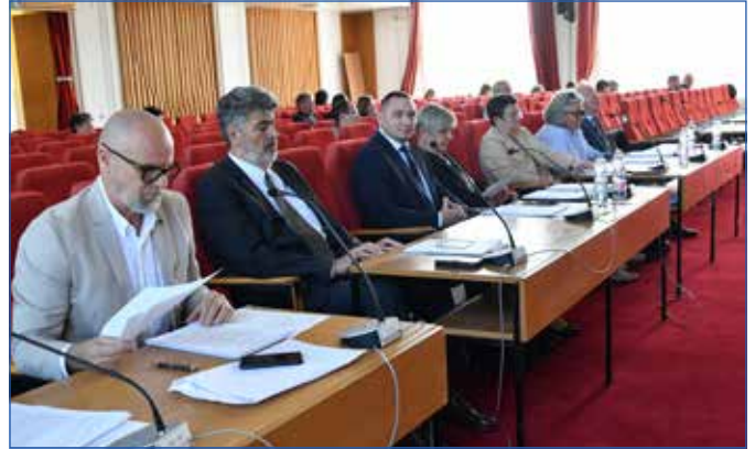
A Fidesz frakció nem vett részt a választások utáni első testületi ülésen

eseti okokat visszaszorítani. Nagy hangsúlyt fektetnek a prevencióra, rendszeresen látogatnak óvodákba, oktatási intézményekbe. Legfőbb stratégiai partnerük a polgárorség, akikkel folyamatos az együttműködés, ahogy az önkormányzattal, a közterü-