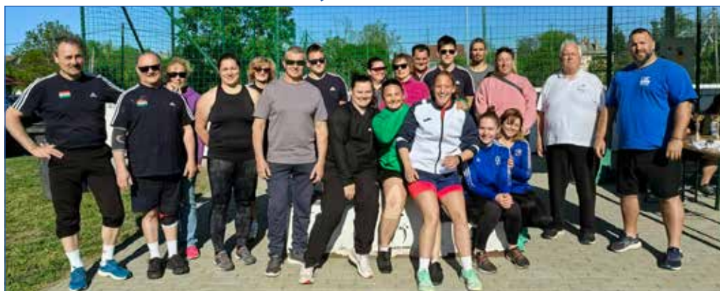
A száz, százötven fiatal mellett szép számmal jelentek meg az idősebb dobóatléták is.