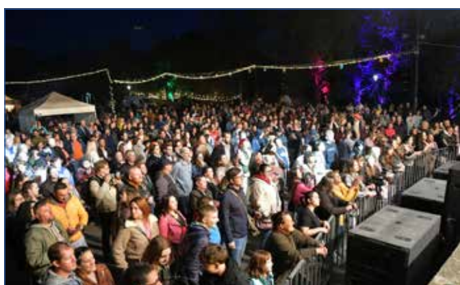
Megtelt a Gödör a Bohemian Betyars koncertjére