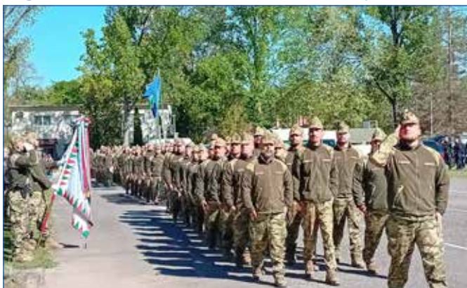
Hagyományosan ezredsorakozóval indult a rendezvény

A harminc éves múltú vizsatekintő Műszakiak napján hagyomány szerint ünnepélyes ezredsorakozóval indult a prog-