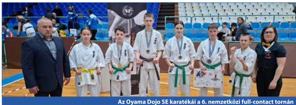
Az Oyama Dojo SE karatékái a 6. nemzetközi full-contact tornán

Fantasztikus eredményeket értek el május 2-án az Oyama Dojo SE karatékái a 6. nemzetközi full-contact tornán, Görögországban, Kavala városában.