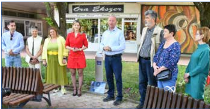
A Napernyős lány szobránál is található egy QR kódos pont