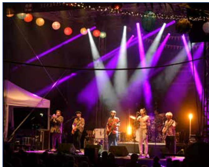
Május 1-jén lépett fel a Bohemian Betyars