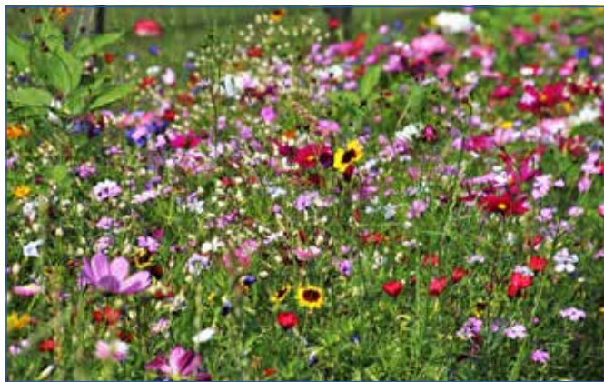
Pihentesd a fűnyíród májusban!

A „Vágatlan május” ugyanakkor a biológiai sokféleség támogatására irányuló gesztus, amely szemléletváltásra sarkall. A fűnyírásmentes május 2019-ben Angliából indult, hogy tudatosítsa az embereket: a vadvirágokkal tarkított gyepek nem a hanyagság jele, sokkal inkább a környezettudatos hozzáállás. Ha szemet hunyunk a kertünkben „gyomként” nyíló mezei virágok