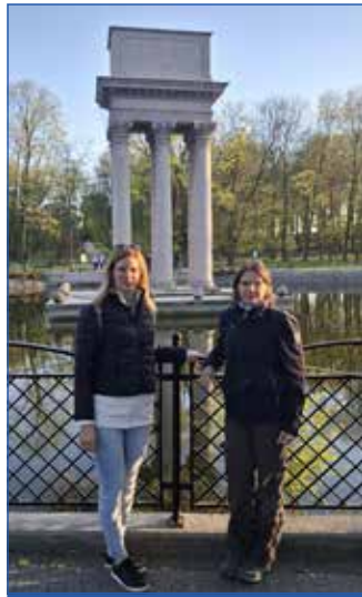
A tanárok a Bem mauzóleumnál