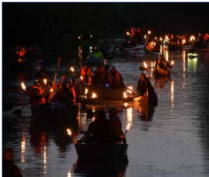
Fáklyás felvonulás a Kurcán