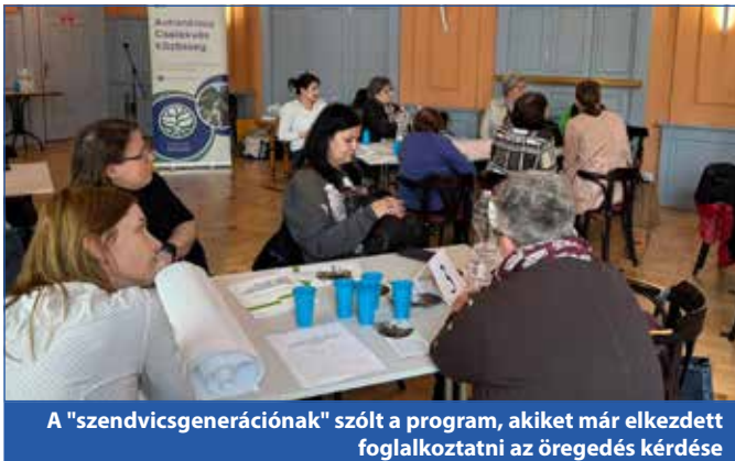
A "szendvicsgenerációnak" szólt a program, akiket már elkezdett foglalkoztatni az öregedés kérdése