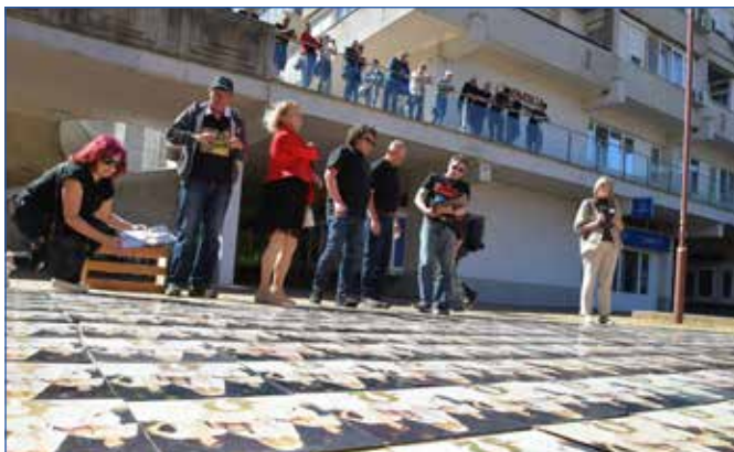
A Csillagok útján című album 220 példánya a Szent Miklós téren.

Számos értékes relikviát állítottak ki a zenekar hagyatékából, köztük személyes tárgyakat, hangszereket, fellépőruhákat, és a legendás törökbálinti P stúdió